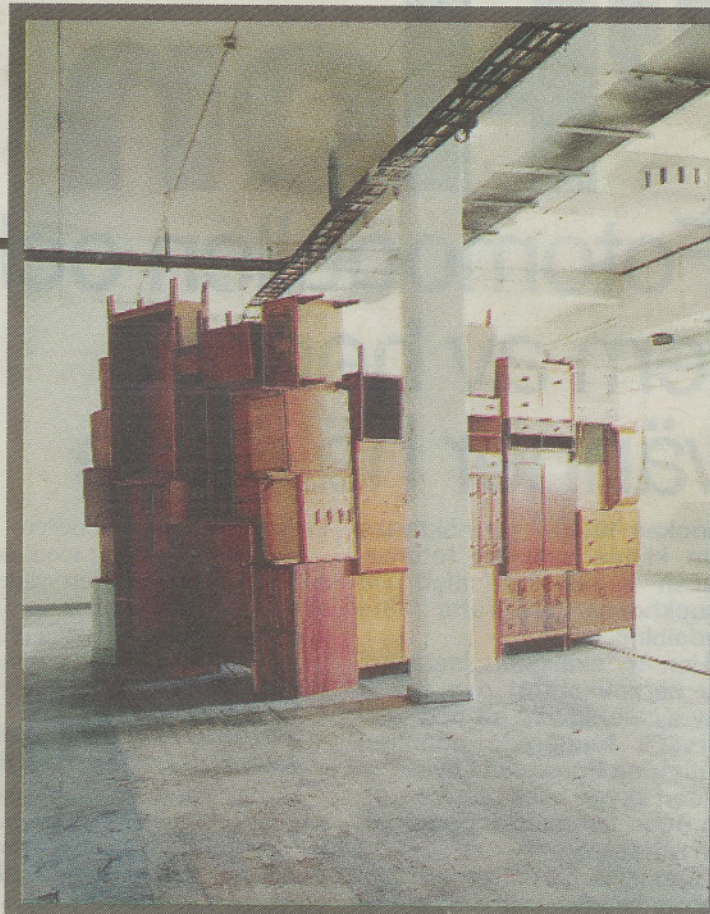
Skulptur av Annelie Wallin på Lumafabriken.